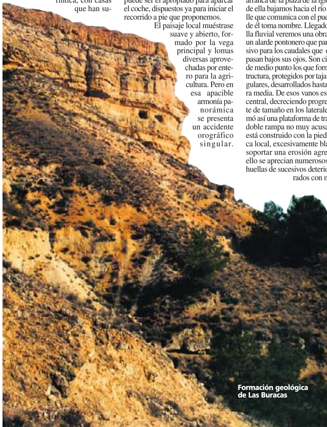
Formación geológica de Las Buracas

Llegamos así hasta un pequeño mirador construido para aliviar la sensación de vértigo que se origina al asomarse hacia el abismo. Apoyados sobre el pretil podemos contemplar, más confiados, el grandioso panora-