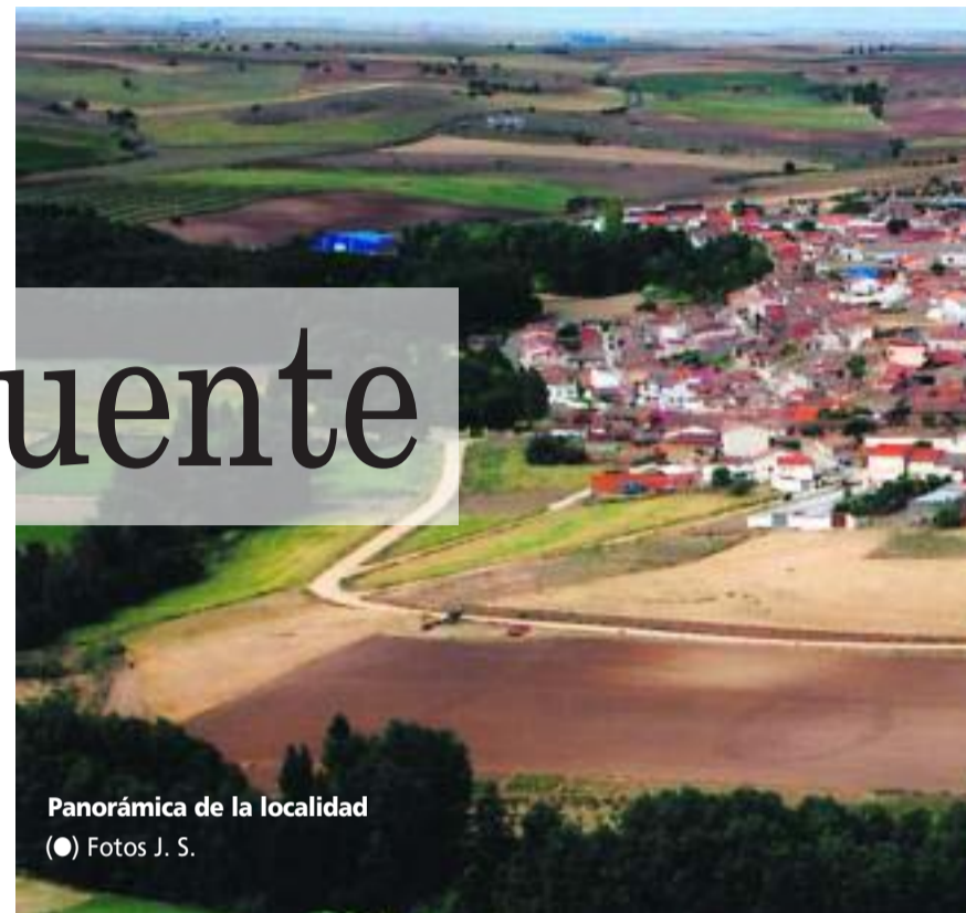
Panorámica de la localidad

El itinerario que hemos elegido arranca de la plaza de la iglesia. Desde ella bajamos hacia el río por la calle que comunica con el puente y que de él toma nombre. Llegados a la orilla fluvial veremos una obra singular, un alarde pontonero que parece excesivo para los caudales que de común pasan bajos sus ojos. Son cinco arcos de medio punto los que forman su estructura, protegidos por tajamares angulares, desarrollados hasta una altura media. De esos vanos es mayor el central, decreciendo progresivamente de tamaño en los laterales. Se formó así una plataforma de tránsito con doble rampa no muy acusada. Todo está construido con la piedra arenisca local, excesivamente blanda para soportar una erosión agresiva. Por ello se aprecian numerosos parches, huellas de sucesivos deterioros reparados con materiales